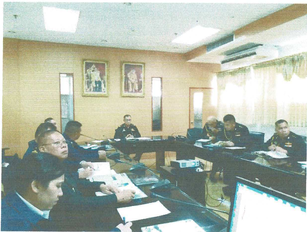
ภาพกิจกรรมการประชุม ก.พ.ร. ชุด.ทหาร ครั้งที่ ๒/๖๑ เมื่อ ๑๙ เม.ย.๖๑ ณ ห้องประชุม กลก.ชุด.ทหาร โดยมี รอง จก.ชุด.ทหาร เป็นประธาน